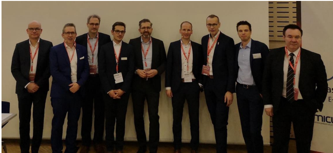
Topreferenten aus Wirtschaft und Politik auf dem Glasfaserforum NRW